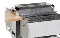
grille verticale - tôle pare-vent verticale