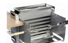
tourne broche avec 3 positions avec/sans tôle pare-vent