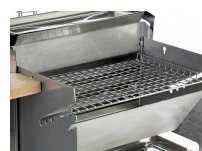
grille horizontale – tôle pare-vent oblique