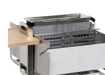
grille verticale - tôle pare-vent verticale