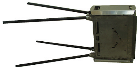
Protéger le côté posé sur le sol

1.1 Poser le foyer sur le côté opposé au passage du cendrier et de la grille foyère , poser le chariot semi monté à côté du foyer (grille du chariot avec cornes vers le haut), insérer les tubes dans les 2 bossages du côté posé sur le sol et fixer avec 2 boulons à ailettes par pied, en serrant les ailettes du côté des tubes.